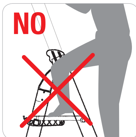
Pedana non calpestabile. La scala non ha il paracorpo