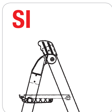
Pedana ammessa esclusivamente per uso porta attrezzi

SICUREZZA: salde impugnature anatomiche in gomma e cerniere in alluminio fuso con interposta frizione