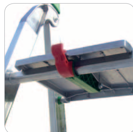
Pedana porta attrezzi in alluminio fuso con gancio di sicurezza